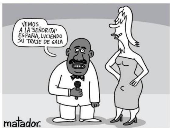
IMAGEN 6: SÁTIRA