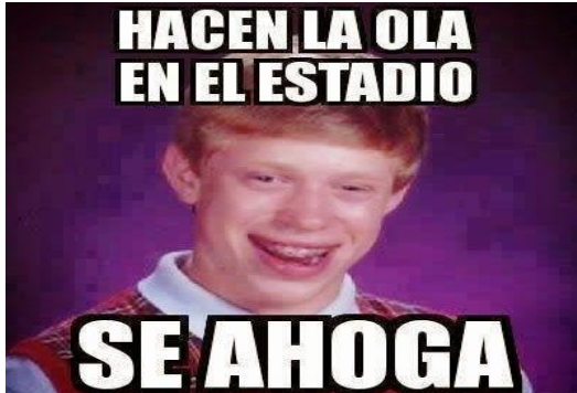
IMAGEN 1: HUMORISMO E IRONIA