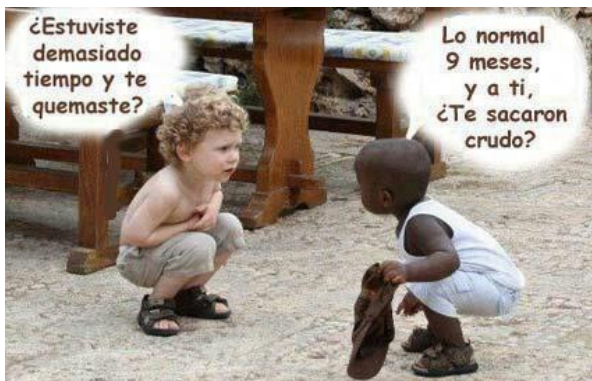
IMAGEN 5: IRONIA

Es humor negro pero es chistoso porque el afrodescendiente se refiere a que el men salio crudo por blanco