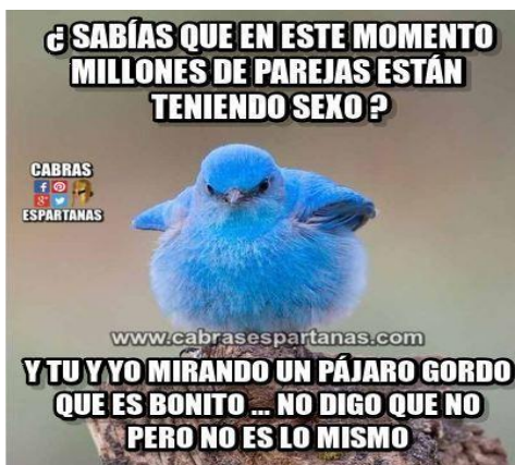
IMAGEN 2: HUMORISMO E IRONIA