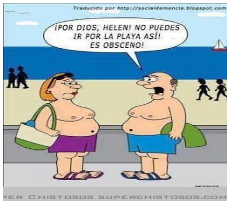
IMAGEN 10: SÁTIRA

Es chistoso porque los dos se parecen sino por el pelo xd