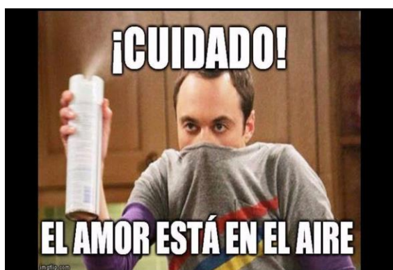
IMAGEN 14: HUMORISMO E IRONIA