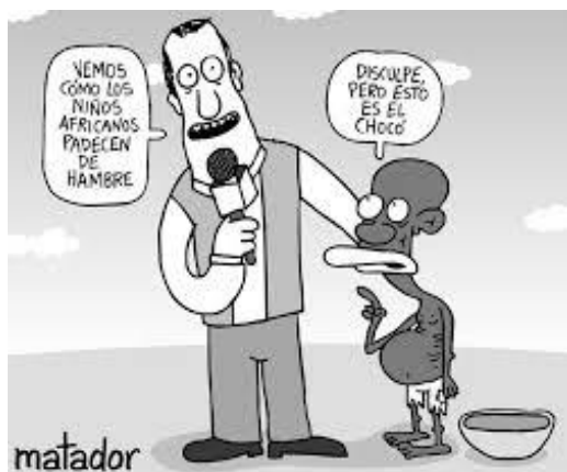
IMAGEN 11: IRONIA

*No hubo opiniones de la imagen ni por estudiantes ni profesores