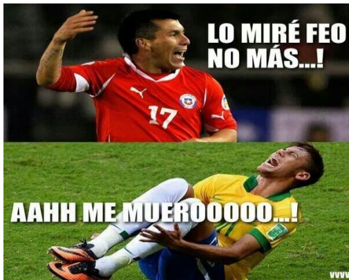
IMAGEN 8: HUMORISMO E IRONIA

Lo que dice es gracioso porque Neymar se tira por todo osea es gracioso