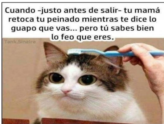
IMAGEN 12: HUMORISMO E IRONIA