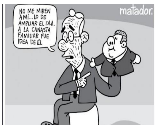
IMAGEN 7: IRONIA