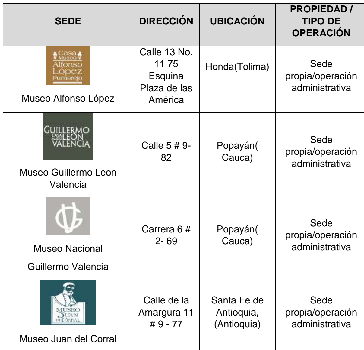
Tabla 1 Descripción sedes Ministerio de Cultura, Fuente: Autor.