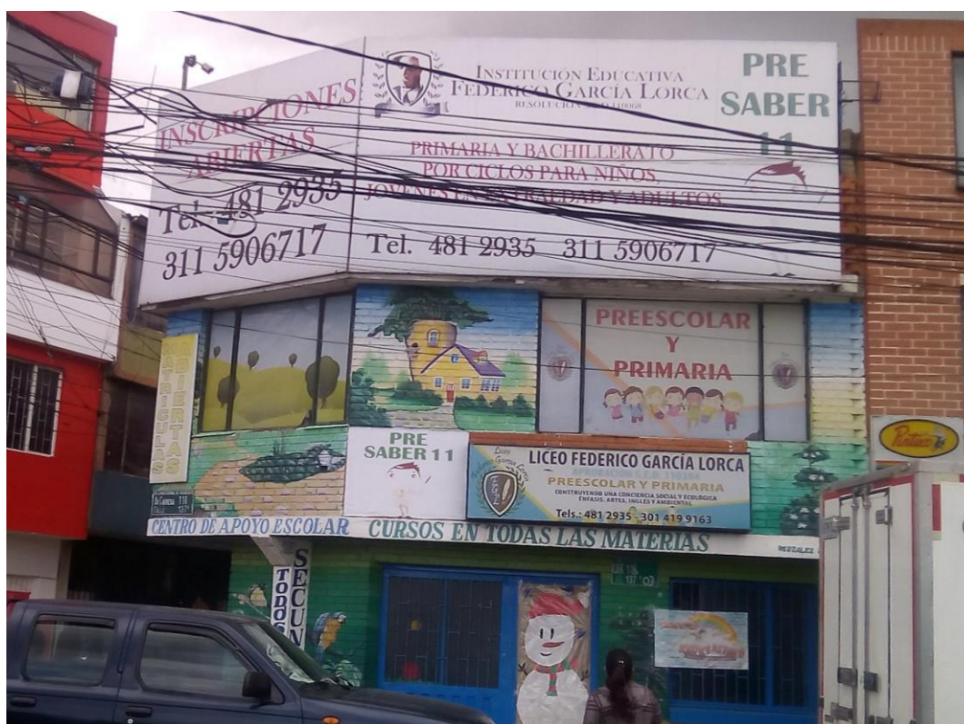
(Registro personal, Liceo F.G.L, Noviembre 2019)