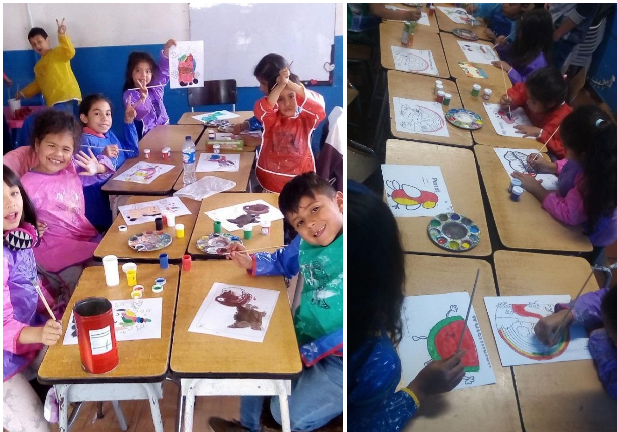
(Registro personal, Liceo F.G.L, grado segundo, Agosto 2019)