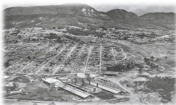
Img 10. San Cristóbal década de los 70.