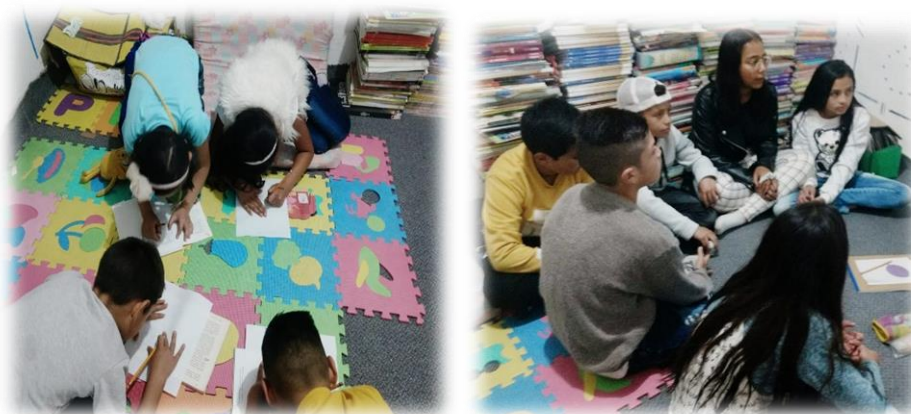
Img 3 & 4 Taller: “ Nuestros relatos ” (07-03-2020)

Desde los talleres se construyeron dinámicas de participación activa, permitieron llevar a cabo la primera fase de los talleres, en donde se reconocieron algunas de las capacidades, habilidades y sentimientos individuales, por medio de ejercicios sensibles, como por ejemplo, la narración oral, y escrita de sus relatos, sus recuerdos, o anécdotas importantes en la vida de cada niño, niña o joven que participó del ejercicio, para luego compartirlas en un círculo de palabra.