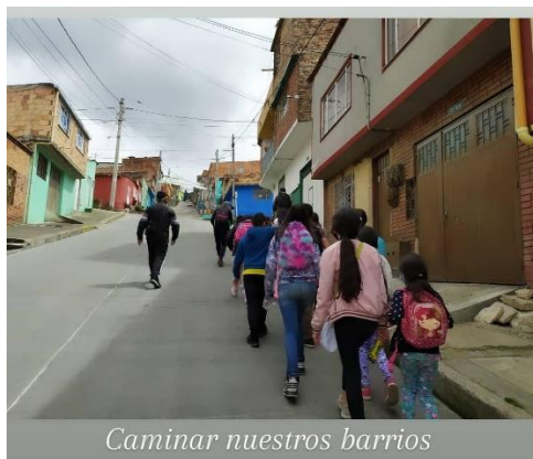
Img 12 Taller “ Construimos territorio, memoria e identidad ”.

“turistas” 46 en su propio territorio pues ya no solo eran habitantes de una casa sino habitantes de un territorio cargado de memorias colectivas y de identidad.