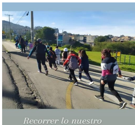
Imag 8 Taller “ Construimos territorio, memoria e identidad ”. (11/12/2020)

diferentes expresiones de la reconstrucción de la memoria colectiva de los habitantes del barrio La Gloria, Localidad de San Cristóbal.