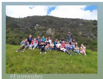
Img. 15 Taller “ Construimos territorio, memoria e identidad ”.

Si bien, los adultos mayores en sus relatos mencionan algunos procesos políticos de lucha por la permanencia y dignificación dentro del territorio, también hablaron sobre la pérdida de apropiación del mismo y la naturalización de las problemáticas sociales “ya los muchachos de ahora no se preocupan por nadie, ni nada cada uno anda metido en su cuento” (Diario #7 diciembre 2020) como un reflejo en la carencia de participación dejando el manejo y control del mismo sobre otros grupos selectos, quienes en ocasiones no conocen las problemáticas particulares de los barrios.