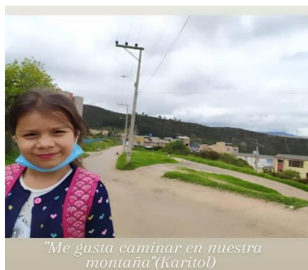
Imag 7 Taller “ Construimos territorio, memoria e identidad ”. (11/12/2020)

referencia en los relatos de los adultos mayores y en el de los niños, niñas y jóvenes de QIMENKA se da cuenta de esa unión implícita entre el espacio y las relaciones sociales.