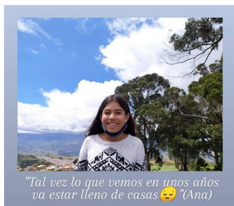
Img 9 Taller “ Construimos territorio, memoria e identidad ”. (11/12/2020)

En la imagen se evidencia una frase que dijo una de las niñas, ella dice esto con base en lo que los adultos mayores relataron en los talleres anteriores pues reconoce que muchos de los espacios o lo que en algún momento se consideró “reserva ambiental” han sido invadidos por constructoras que se han dedicado a urbanizar algunos fragmentos de la montaña.