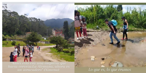
Img 13-14 Taller “ Construimos territorio, memoria e identidad ”.

en este caso particular fue sobre la quebrada, pero en otros era sobre la cantidad de casas que existían y el crecimiento de la localidad.