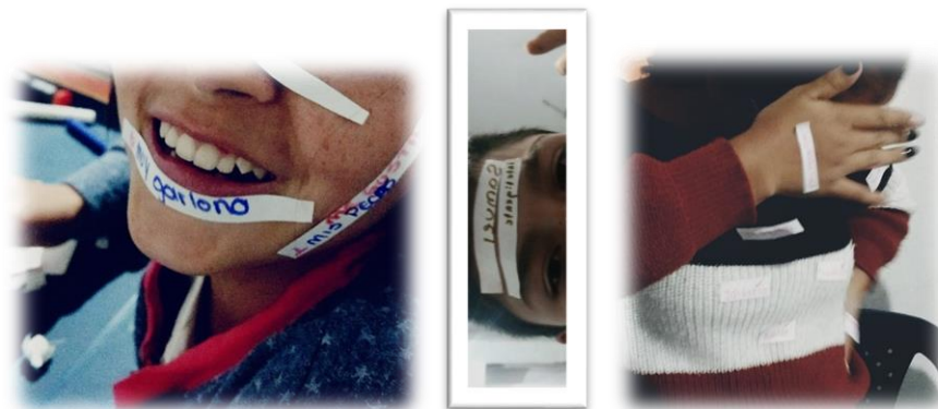
Img 1, 2 & 3: Taller: “ Rótulos de lo que soy ” (14-03-2020)

Desde los talleres se construyeron dinámicas de participación activa, permitieron llevar a cabo la primera fase de los talleres, en donde se reconocieron algunas de las capacidades, habilidades y sentimientos individuales, por medio de ejercicios sensibles, como por ejemplo, la narración oral, y escrita de sus relatos, sus recuerdos, o anécdotas importantes en la vida de cada niño, niña o joven que participó del ejercicio, para luego compartirlas en un círculo de palabra.