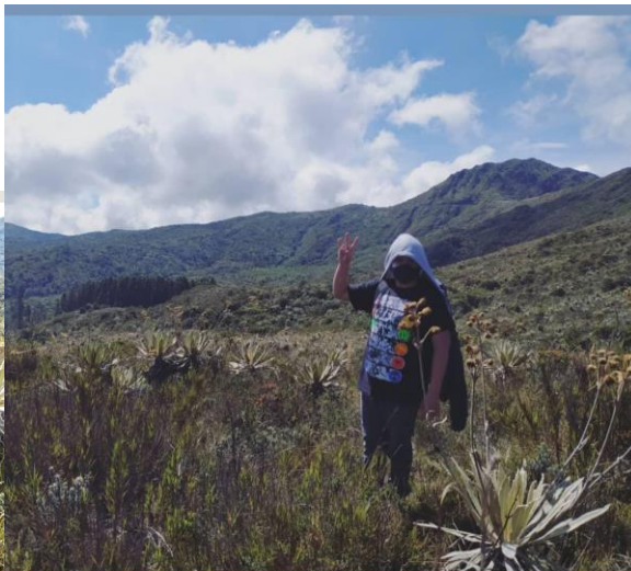
" Que bellos los frailejones" (JuanDa)