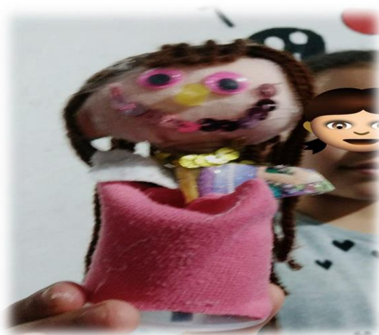
Img 4 Taller: “¿Cómo me siento?”

A mí el barrio me sabe a pan cuando paso por la esquina y me huele a cerveza cuando es sábado en el parque (Diario C. #3 marzo 2020).