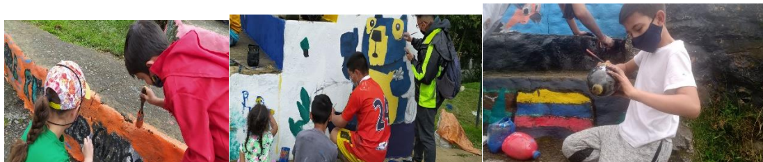
Img 17, 18 & 19 QIMENKA pintar su cancha

empezaron a dar aportes al mismo tiempo [...] .si profe, así como hacían antes los abuelos” (Diario #10 Diciembre 2020) los niños, las niñas de QIMENKA se convirtieron en actores políticos y activos de su barrio, pues a partir de las experiencias ajenas y propias buscaron otras formas de participación dentro del barrio.