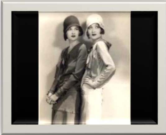
Figura 1: Mujeres y época 7