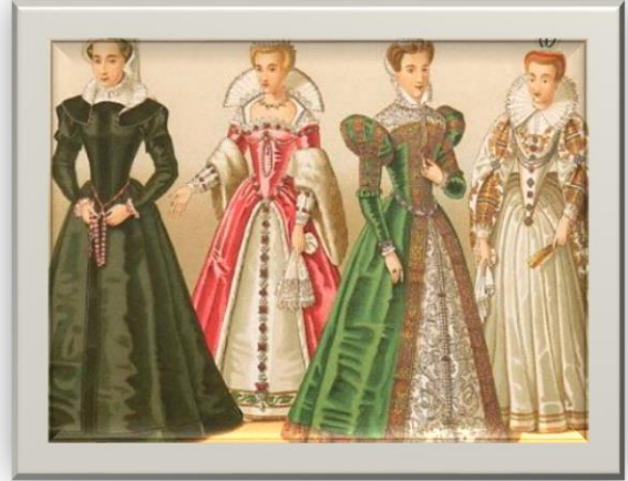
Figura 2: Las mujeres a través de la historia 8