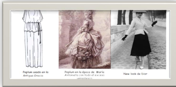
Figura 5: El corte plepum: La moda de Lolita 11