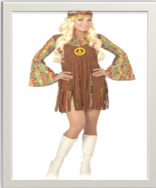
Figura 3: Mujer Hippie 9