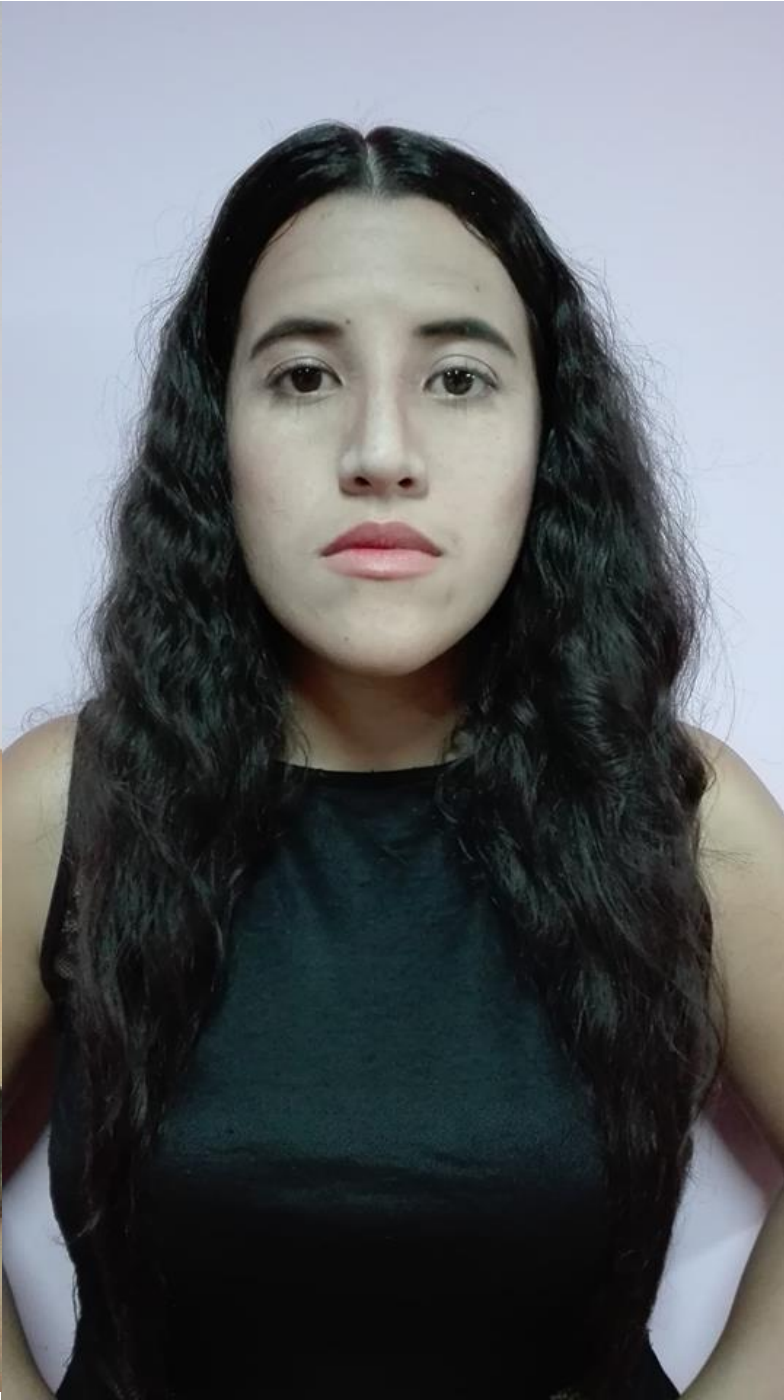
Ilustración 4. Foto después de implementar las características del personaje