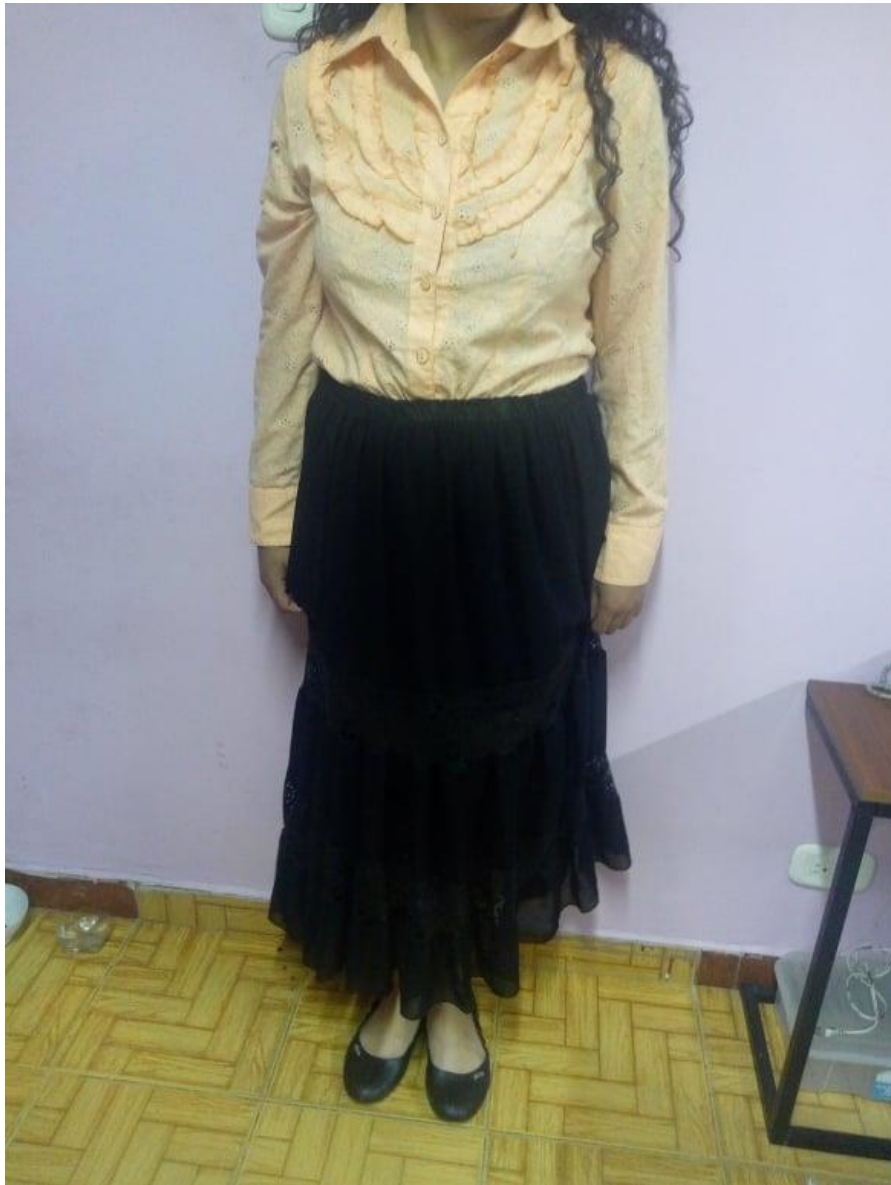
Ilustración 7. Vestuario escogido Total

Seleccioné falda negra, zapatos negros y blusa rosa, y ya después buscando prendas de estos colores encontré la falda negra larga y blusa rosa manga larga ya que mediante estudio socio-cultural de la Ciudad Juárez encajarían bien con el personaje.