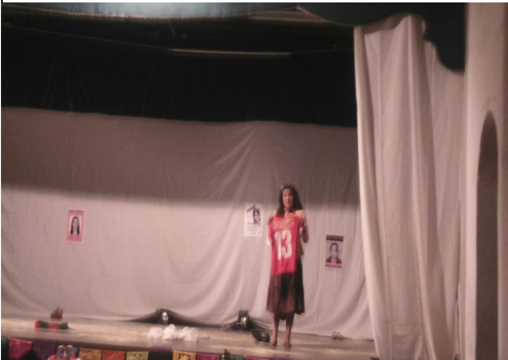
Ilustración 9. Función Teatro Municipal de Mosquera- Cundinamarca