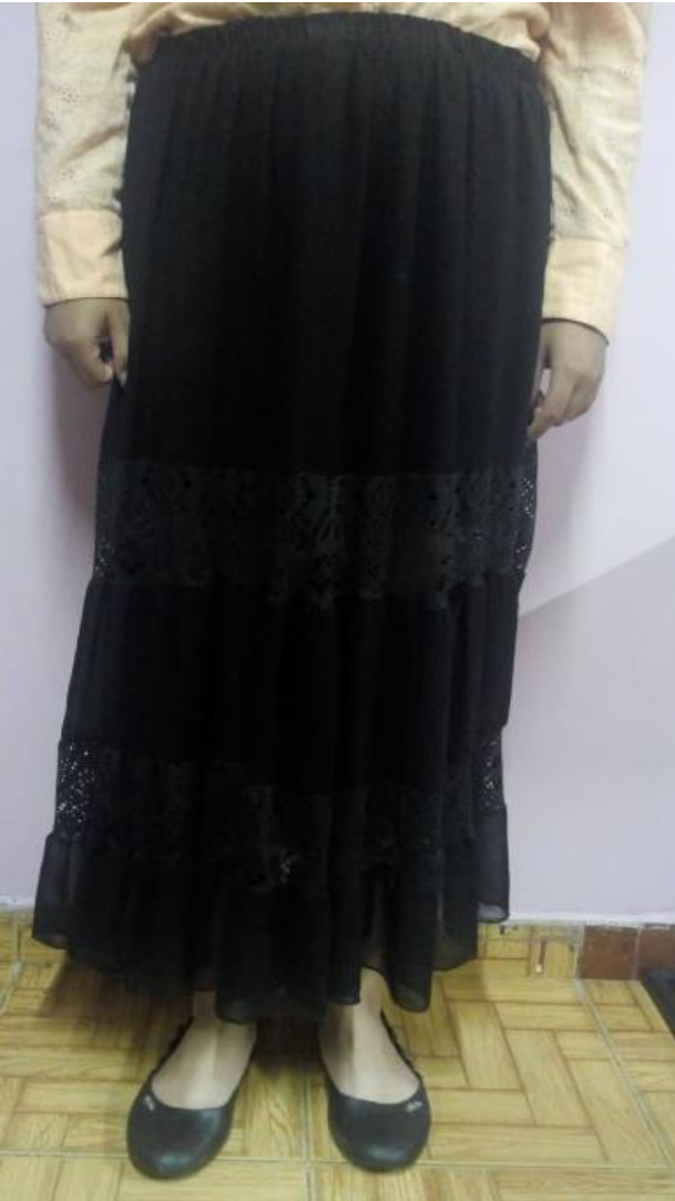
Ilustración 5. Vestuario escogido parte inferior