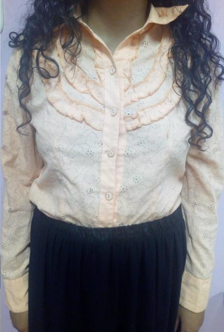
Ilustración 6. Vestuario escogido parte superior