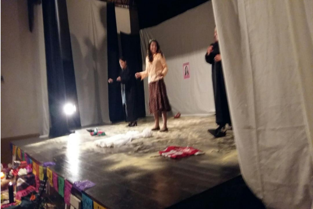
Ilustración 8. Función Teatro Municipal de Mosquera- Cundinamarca