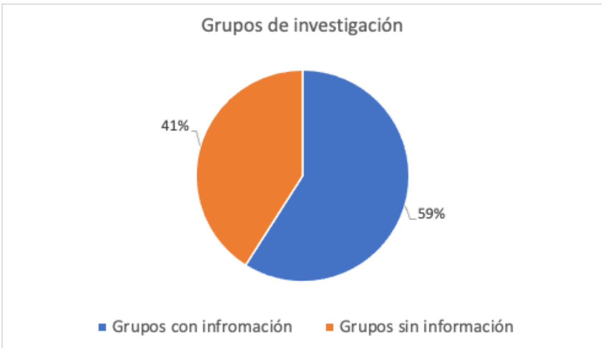
Gráfica. 2 Porcentaje de información recolectada.