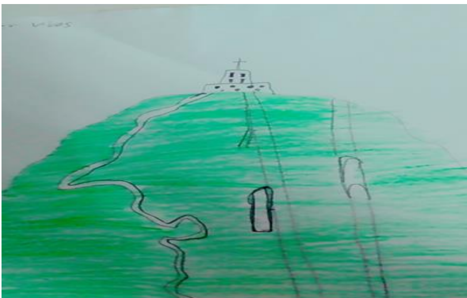
Ilustración 3 Noción de naturaleza Angélica Vives, 8 años, quien representa por medio de un dibujo “Montserrat”.