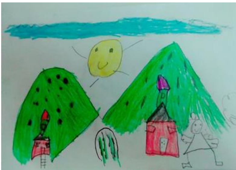
Ilustración 10 Noción de naturaleza Eileen Tirado, 6 años, quien representa por medio de un dibujo “ Es una casa en la belleza que es donde vivo, la otra casa es en Granada- Tolima que es donde vive mi abuelita y allí vivia con mis papas, mi hermano y mi primo Michel

Lo encontrado se evidencio a través de los siguientes dibujos.