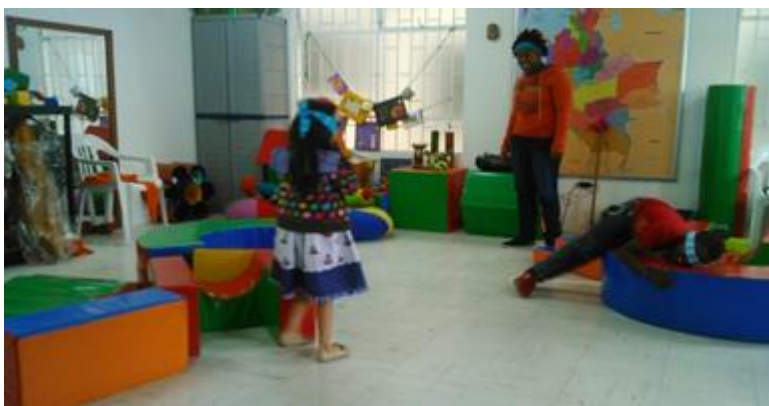
Ilustración 1 tomada del informe Casa de memoria y lúdica “Ubuntu” Por Carolina Orjuela

Estos centros son creados en búsqueda de brindar una atención integral a cada una de las familias buscando generar garantías de no repetición, esto según la ley víctimas y restitución de tierras 1448 de 2011, basados en dicha ley estas entidades se crean con el fin de generar procesos de reparación integral y allí se propone satisfacer medidas de indemnización según el daño causado a la víctima, restitución siendo un proceso que busca que el afectado reciba el mismo bien del cual fue despojado, rehabilitación en el caso de las afectaciones físicas y psicológicas, garantías de no repetición, buscando así en general el restablecimiento de los derechos de las personas víctimas del conflicto armado.