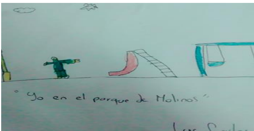
Ilustración 6 Noción de naturaleza Luis Carlos, 8 años, quien representa por medio de un dibujo “Yo en el parque de molinos”.