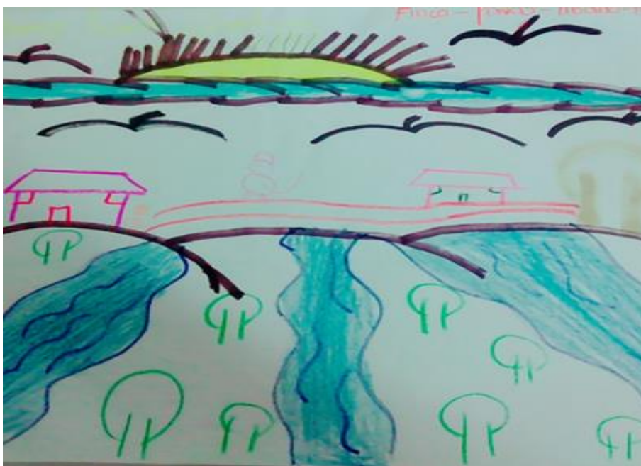
Ilustración 13 Noción de naturaleza Shaira, 8 años, quien representa por medio de un dibujo “Finca pavas- líbano en donde vivía antes, y me montaba en los árboles de guayaba para comermelas y jugar ”