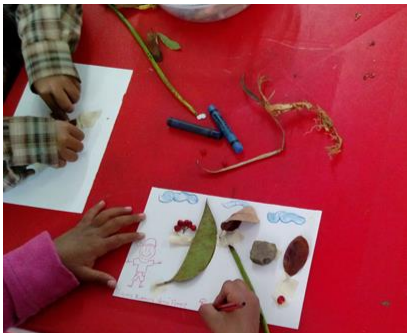
Ilustración 16 Noción de naturaleza plasmada desde las artes con material natural.

importancia de la naturaleza, desde estas actividades se ofreció un espacio y recursos con total libertad para poder expresar sus emociones, expresiones y vivencias.