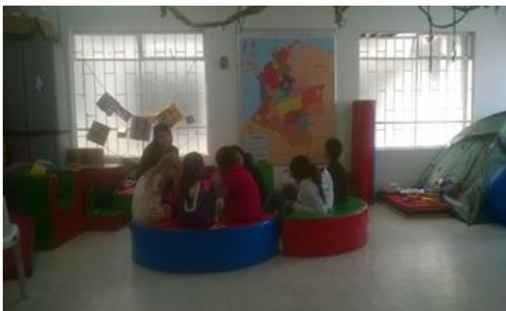
Ilustración 2 tomada del informe casa de memoria y lúdica "Ubuntu" Por Carolina Orjuela.