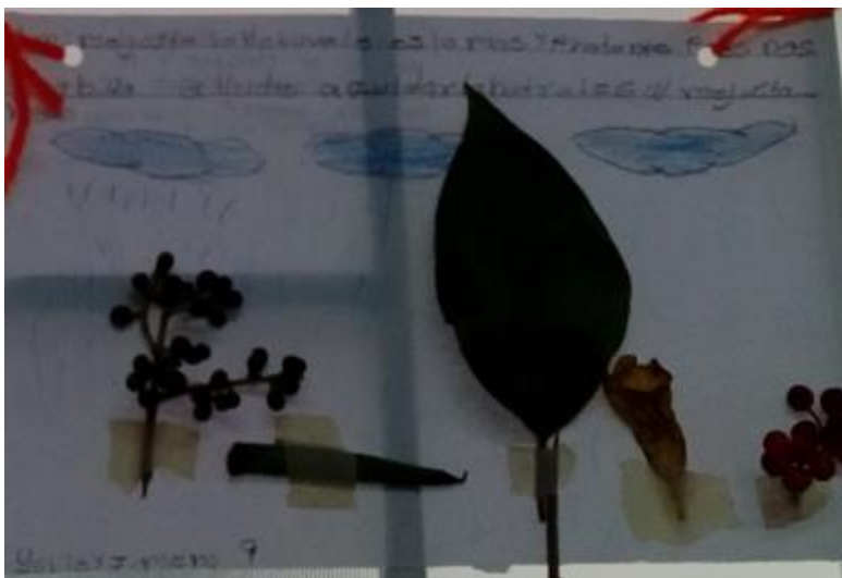
Ilustración 17 Noción de naturaleza plasmada desde las artes con material natural.