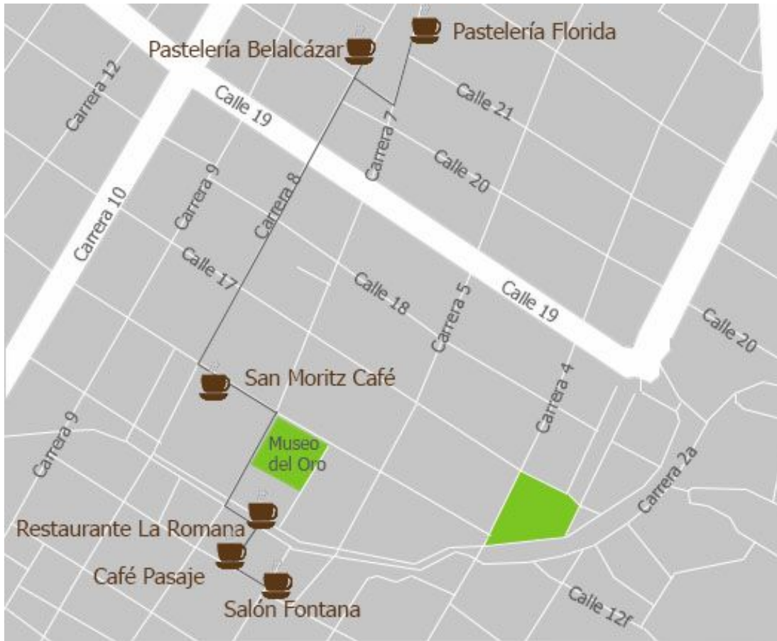
Anexo, Recorrido por los cafés históricos de Bogotá (mapa levantado por los investigadores en febrero de 2017).

Los seis cafés anteriormente mencionados hicieron parte de la Red de propietarios de Cafés que hace parte del programa Bogotá en un café, que se llevó a cabo bajo el Plan de Desarrollo Bogotá Humana y el Instituto Distrital de Patrimonio Cultural, programa que tenía como objetivo la recuperación y difusión de los lugares de memoria histórica con el fin de promover y fomentar la apropiación del patrimonio cultural. Parte del programa incluye: Conformación de la Red de los Cafés del Centro Tradicional; Recorridos turísticos por los cafés y lugares históricos de la