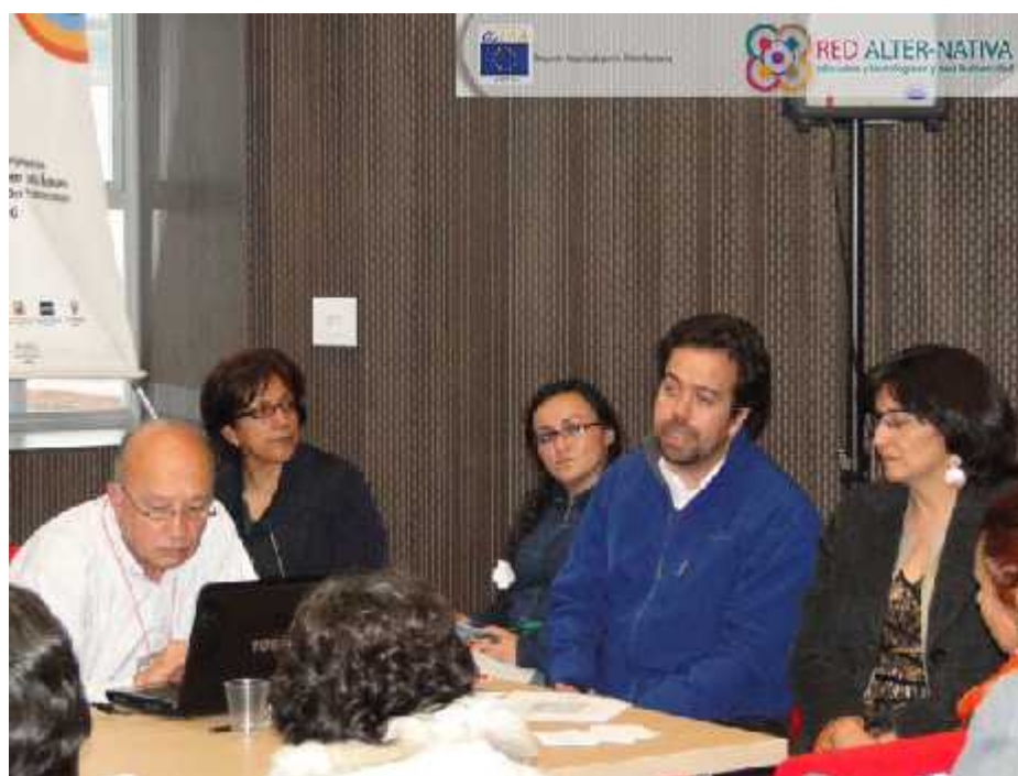
Figura 17: Primer encuentro anual red alter-nativa educación y tecnología en y para la diversidad.