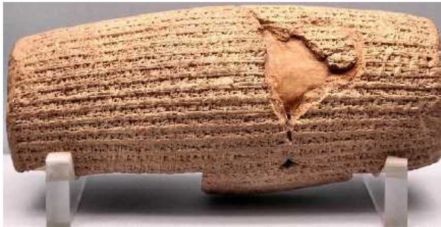
Figura 4: Escritura Cuneiforme.

su preservación, un ejemplo de esto son algunas escrituras cuneiformes encontradas en tablas de madera, con abecedarios proto-alfabético de la civilización Fenicia 2 .