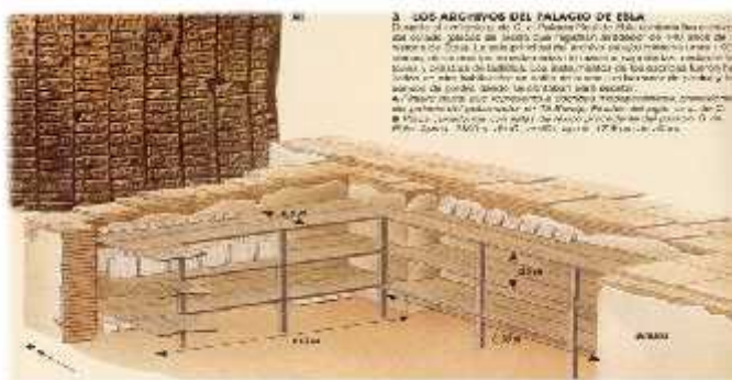
Figura 9: Archivos de Palacio de Ebla, Mesopotamia.

Las inscripciones más solemnes se grababan sobre mármol o diorita, suponen un porcentaje muy pequeño comparado con la documentación encontrada en tabletas de arcilla. Estas inscripciones solemnes se emplearon en los monumentos.