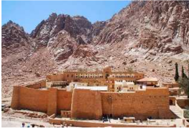
Figura 10: Biblioteca Janub Sina (Egipto).

El libro egipcio es el primero que utiliza la tinta y una materia ligera, el papiro , que podría ser considerado como antecesor del papel. El papiro crecía en el Delta del Nilo, se extraían unas fibras que posteriormente se prensaban y se disponían formando un tejido sobre el que se escribía con caña o pluma y con tinta negra fabricada a partir de hollín y de la resina de la planta. Además, pronto utilizaron tinta roja para todo aquello que se consideraba importante. La utilización de tinta de diferentes colores favoreció la aparición de ilustraciones. Se guardaban enrollados formando volúmenes , los cuales a su vez se guardaban en estuches de cuero y estos en cajas de madera y ánforas.