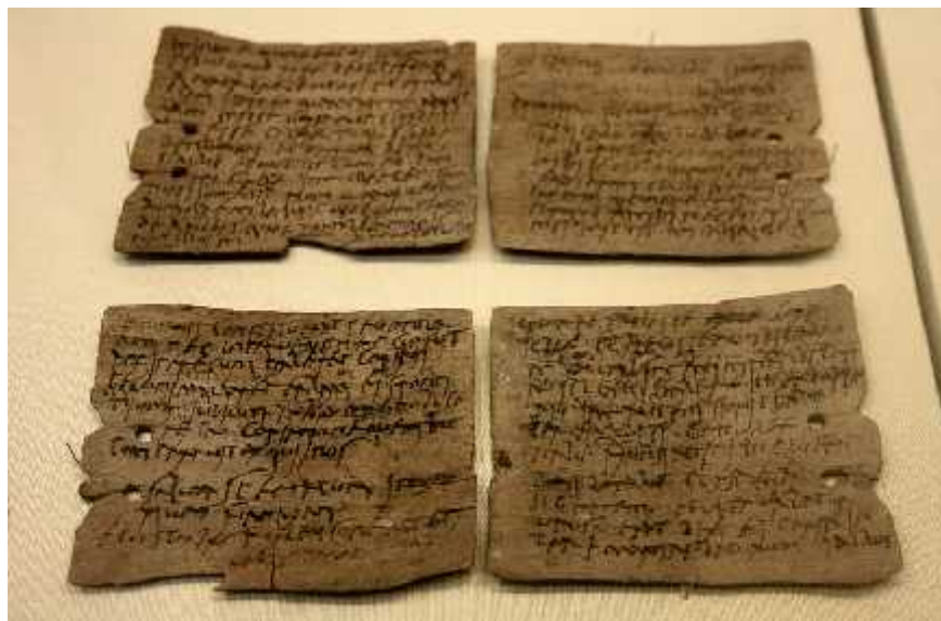
Figura 8: Tablillas de Vindolanda (siglos I-II d.C.) correspondientes a una petición de suministros.

Pero es en Roma gracias al desarrollo económico que comienza el papiro a establecer un contacto a nivel educativo, pero ya que el imperio era recio y quería su propio estilo; se instauraron los códex o Códice. Inicialmente consistía en una derivación de tablillas de madera que intercalaban entre sí hojas de papiro y posteriormente, de pergamino dando lugar al denominado “ Liber quadratus ”. Su evolución se mantuvo hasta que desaparecieron las tablillas, su forma fue cambiando de cuadrada a rectangular y se fueron cociendo sus hojas, hasta adoptar la forma del libro que hoy manejamos.