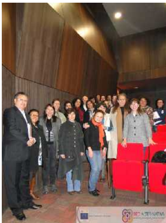
Figura 16: Primer encuentro anual red alter-nativa educación y tecnología en y para la diversidad.