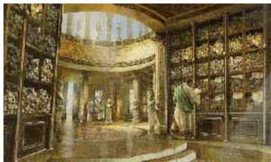
Figura 11: Biblioteca de Alejandría.

Alejandría se sitúa geográficamente dentro de Egipto, sin embargo, pertenece a la cultura helenística. Ptolomeo II fundó en el siglo III a. C una institución al estilo griego a la que llamó Museion (Templo de las Musas), que estaba dedicado a la enseñanza y a la