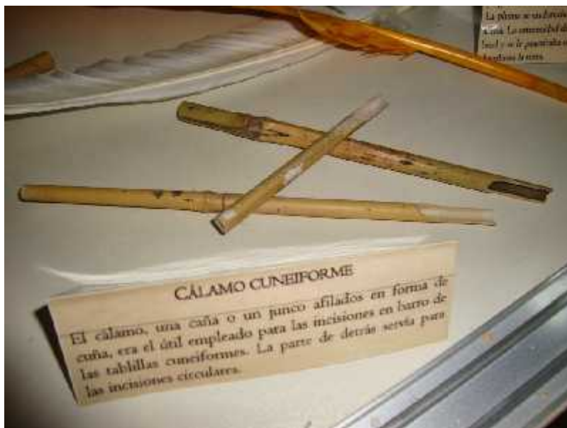
Figura 5: Cálamo Cuneiforme.