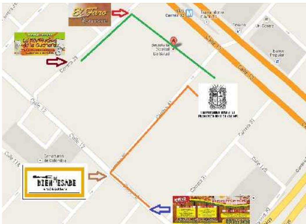
Figura 13: Mapa restaurantes.

LOS RESTAURANTES QUE ENCONTRARA EN EL MAPA, ESTÁN CERCA DE LA BIBLIOTECA Y CENTRO CULTURAL DE LA UNIVERSIDAD DISTRITAL FRANCISCO JOSÉ DE CALDAS, USTED NO TENDRÁ QUE DESPLAZARSE MÁS DE UNA CUADRA DEL SITIO DEL EVENTO. A CONTINUACIÓN ENCONTRARÁ EN EL MAPA CUATRO RESTAURANTES EN LOS QUE QUE USTED PODRÁ DISFRUTAR DE UNA BUENA GASTRONOMÍA.