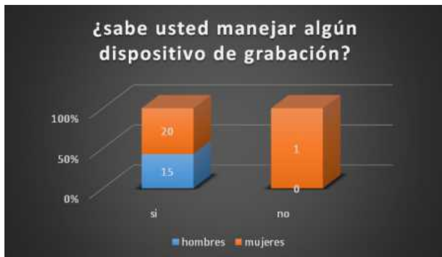
Tabla 2: Resultado encuesta dispositivos de grabación

Aunque no era difícil ya que cualquier dispositivo de grabación es válido y todos cuentan con celulares que pueden hacer el trabajo, sin embargo, se les dio una inducción y acompañamiento para el trabajo final si preferían trabajar desde la clase o desde su casa.