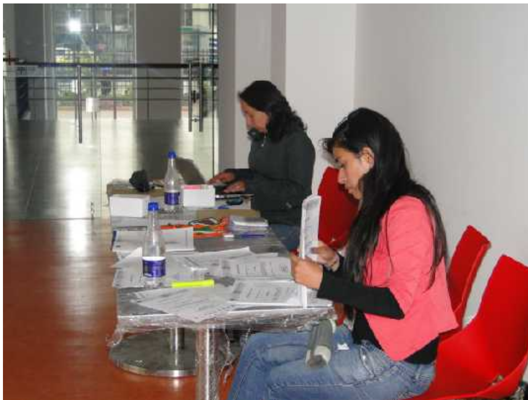
Figura 18: Primer encuentro anual red alter-nativa educación y tecnología en y para la diversidad.