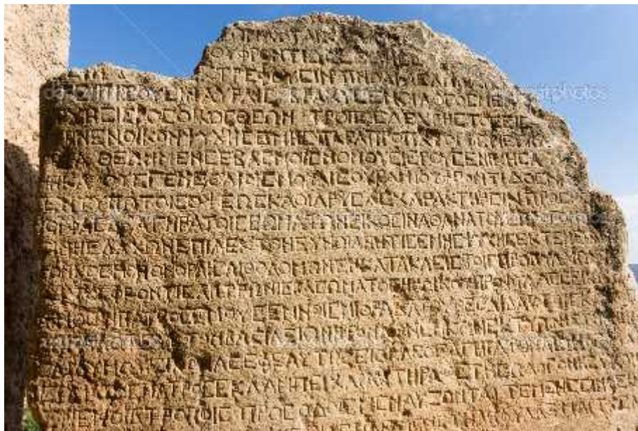
Figura 6: La escritura griega antigua cincelado en piedra

En el siglo VII a. C. se impone en Grecia la escritura fenicia . El alfabeto griego se inventa en el siglo V a. C., y cuenta con 24 signos de los cuales siete (7) son vocales (inventadas por los griegos). Los romanos toman y adaptan la escritura griega y la convierten en el abecedario latino, que se consolida en el siglo III a. C.