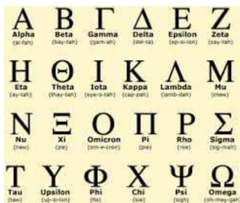
Figura 7: Alfabeto griego.