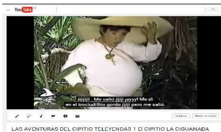
Figura 19: Pantallazo, edición video canal CALE, YouTube.