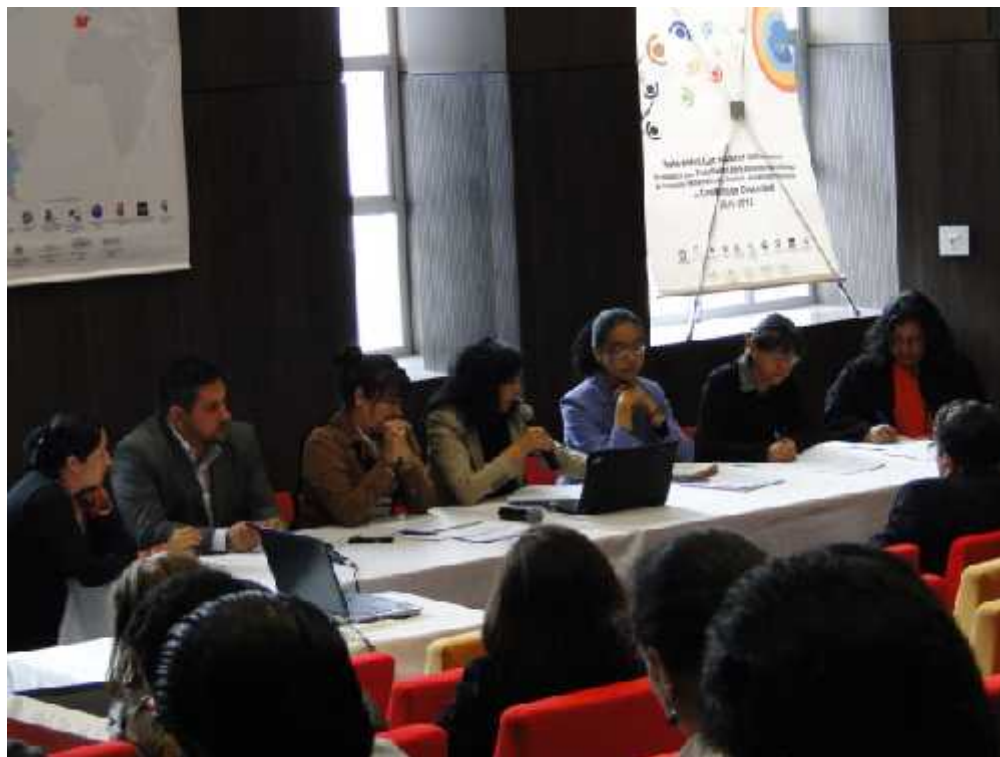
Figura 15: Primer encuentro anual red alter-nativa educación y tecnología en y para la diversidad.