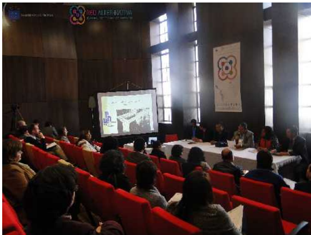
Figura 14: Primer encuentro anual red alter-nativa educación y tecnología en y para la diversidad.