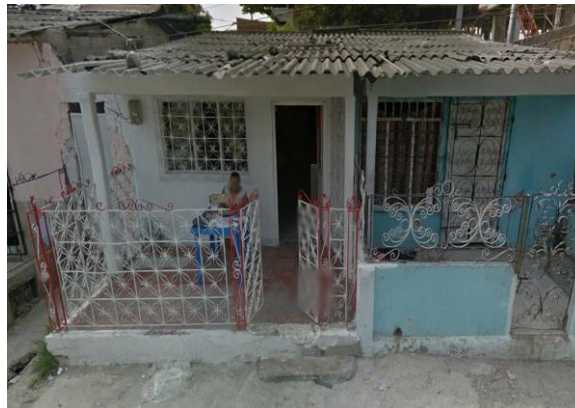
Ilustración 5. Fachada google earth