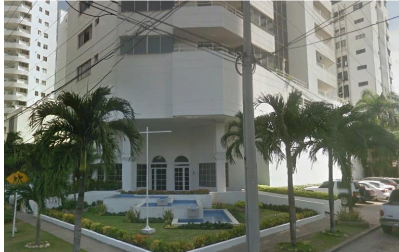
Ilustración 5. Fachada google earth