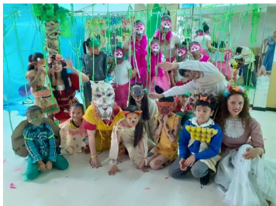
Ilustración 3. Muestra final Exploradores

Por último, cada faro y su comunidad hizo la representación de un ambiente particular de su región de forma creativa y con el uso de materiales reciclados en un espacio específico de la fundación y así las hermanas pudieran tomarlo en cuenta al momento de evaluar y elegir una comunidad ganadora.