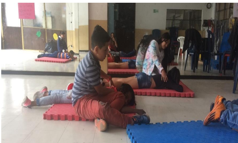
Ilustración 6. Sesión de masaje al otro con Navegantes.

Estos ejercicios permitieron que los niños se soltaran ante las tensiones que normalmente tienen y que se reflejan al momento de bailar, soltar el cuerpo, liberar todo el peso sobre el peso del otro son acciones físicas que tienen relación directa con el estado psicológico o anímico que atraviesa el danzante, por eso se cree que permitirles confiar en el otro en el aula es abrirles el espectro a que puedan confiar también en la calle, en el colegio y en general en todos los ambientes donde se desarrolla su vida diaria.