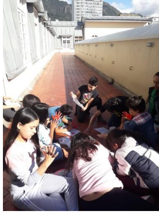
Ilustración 7. Navegantes en taller de semillas, Casabierta 2019

El encuentro entre la fundación y la facultad fue un gran avance dentro de la intención de abrir la perspectiva del mundo y del arte a los niños, ya que, aunque la facultad queda a tres cuadras de la fundación, ésta era desconocida totalmente por ellos; puesto que normalmente circulaban cerca de ella, pero nunca habían tenido la oportunidad de entrar y observar las actividades que allí se realizan.