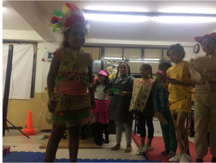
Ilustración 5. Desfile concurso de disfraces.