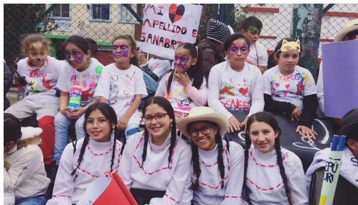
Ilustración 10. Conquistadoras y exploradoras en la comparsa Calle 15.

El sector de La Favorita se caracteriza por tener varias fundaciones y centros de asistencia preventiva distribuidos por toda la zona, por eso se organizó una comparsa que tenía como temática transversal el rechazo al trabajo infantil al que varios niños, niñas y jóvenes pertenecientes a estas fundaciones han sido expuestos. Para esto, se realizaron pancartas, instrumentos musicales con materiales reciclables y se ensayaron arengas para poder corear durante la marcha hacia la plaza central del barrio Santafé en la Calle 22 con Carrera 17 donde se congregaron las diferentes comunidades y organizaciones y se presentaron los diferentes montajes escénicos, dancísticos y musicales que cada fundación había preparado para dicho evento.