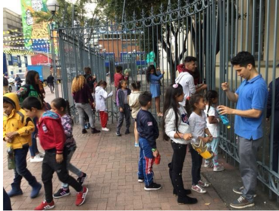
Ilustración 8. Exploradores en taller de creación de ceniceros. Casabierta 2019.

asistieran como público a las muestras de danza urbana, contemporánea, danza búto y banda de rock organizadas por alumnos y maestros de la facultad de Artes ASAB.