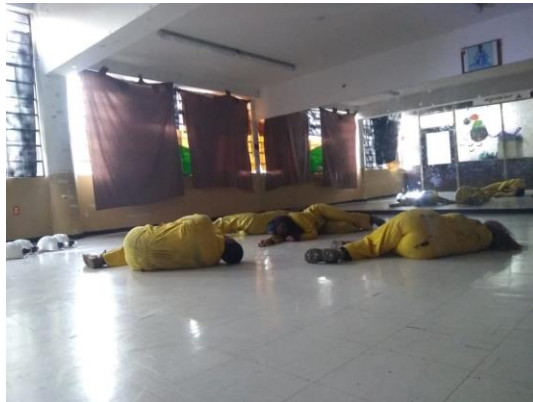
Ilustración 9. Presentación "Día 0", El Club.

Con el ánimo de complementar la celebración del día del niño y al mismo tiempo ofrecer experiencias sensibles a los niños, niñas y jóvenes se planteó llevar un fragmento de la obra Claustrum del colectivo El Club titulado Día 0 donde narran la historia de cuatro mineros que sobreviven 13 días atrapados en una mina, y dentro de ésta empiezan a sobrellevar situaciones de riesgo y ansiedad que los ponen en diferentes estados de alteración físicos y emocionales, en donde el encierro es el detonante para sacar a flote las peores características de cada uno.