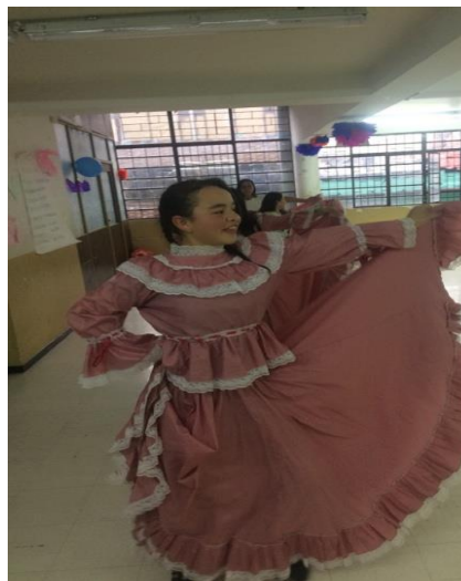
Ilustración 2. Ensayo Cumbia y Tambora

Realizamos también algunas sesiones de creación de vestuario donde se reunieron elementos reciclables y se usaron para construir los disfraces y vestuarios típicos de la región y su biodiversidad. Con la comunidad de exploradores, se agruparon los niños por especies de animales para que de manera conjunta buscaran maneras e ideas de utilizar los elementos a su disposición (botellas, papel, retazos de tela, cartón, plástico, tapas, palillos, pinturas, ropa vieja, recipientes de