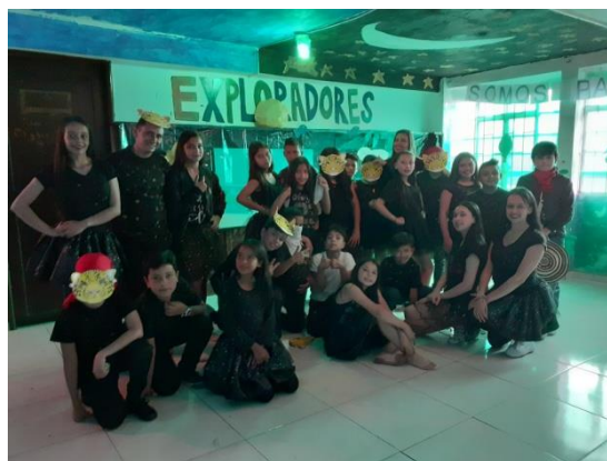
Ilustración 4. Muestra final Navegantes

El día de Halloween se logró evidenciar la capacidad de los niños de compartir, ayudarse entre sí, apoyarse y escucharse para poder presentar un producto escénico representativo y que hiciera honor al territorio nacional que exaltaba. Todos los cortos coreográficos estuvieron muy coordinados, en exploradores la interacción entre los animales fue lo más significativo, y en Conquistadores se exalta la decoración y alegría que se observó en el carnaval, los navegantes en cambio resaltaron en número, pues ellos tenían la mayor cantidad de danzantes y la mayoría de los espectadores disfrutó de la mezcla entre currulao y danza urbana.