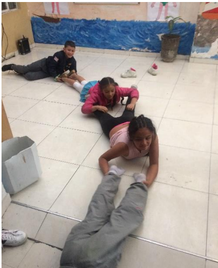
Ilustración 1. Ensayo ritmo "Cien pies"

Se realizó un primer acercamiento a los bailes típicos, cumbia y tambora, en el caso de la región atlántica con Conquistadores, Currulao de la región pacífica con Navegantes y con los exploradores se realizaron danzas zoomorfas y de ritual propias de la Amazonia. Lo anterior con el propósito de familiarizar a las comunidades con los ritmos y pasos básicos de cada género y de manera alterna ir construyendo el montaje final del día de los niños.