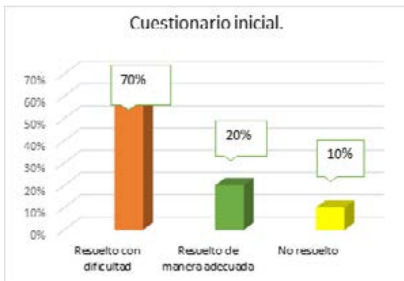
Gráfica 2. Solución de cuestionario inicial.

Para definir el nivel de dominio de la lengua y de vocabulario de la lengua inglesa se aplicó un cuestionario inicial, dentro del cual, se evaluó el dominio de algunas estructuras básicas y el conocimiento del vocabulario relacionado con el huerto, observándose entre otros, los siguientes resultados, solamente el 20% pudieron resolverlo de manera adecuada, el 10 % de ellos decidió simplemente colorear y no resolver las preguntas planteadas, mientras el 70% no comprendió el contenido de los enunciados, correspondientes a las preguntas, estos resultados se evidencian en la gráfica 2, para el caso de los estudiantes que tuvieron muchas dificultades, la docente hizo un acompañamiento para intentar resolver las deficiencias detectadas.