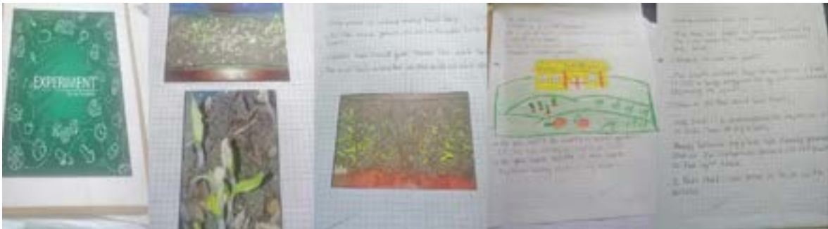
Foto 5. Foto del diario, así como de los posters producidos por los niños como resultado final de la experiencia.

Finalmente, el éxito de los diarios de campo elaborado por los participantes dio su fruto en los posters, donde quedó plasmado el proceso y el resultado final de la experiencia, como se observa en la foto 5.