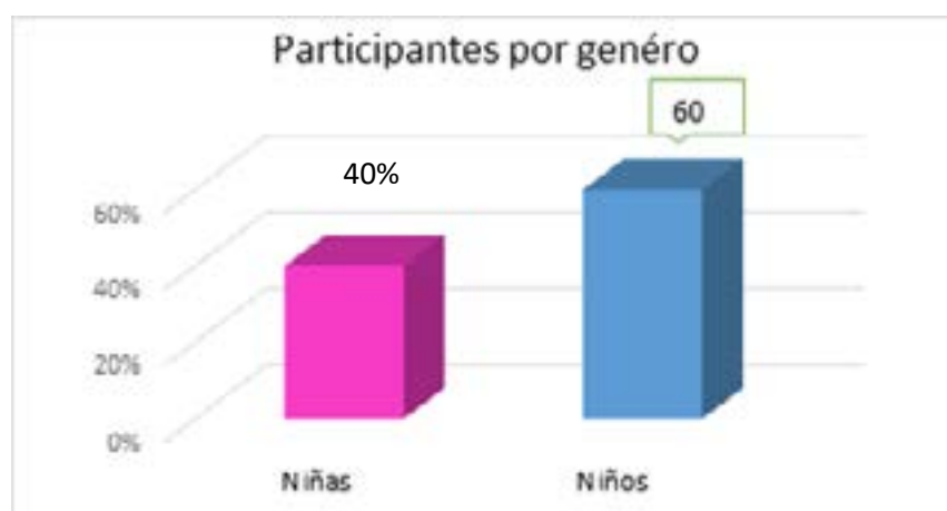
Gráfica 1. Participación por género fuente: propia.

El Proyecto fue desarrollado en un colegio privado mixto de la localidad quinta (5) de Usme de la ciudad de Bogotá, cuyos estudiantes son de estrato socioeconómico de nivel 2, los participantes correspondientes a dos grupos de estudiantes del grado quinto, donde 40% eran niñas y 60% eran niños, tal como se aprecia en la gráfica 1, sus edades oscilaban entre 11 y 14 años.