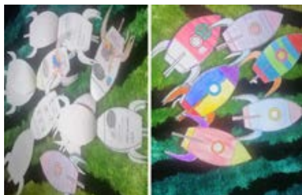
Foto 1. Presentación de la actividad del huerto en forma de nave espacial.

Una vez tomada la decisión de organizar un huerto se optó por seleccionar el espacio dentro del colegio donde se instalaría, el cual surge como una alternativa viable, pretexto para experimentar y aprender inglés de una manera dinámica, favorable e interesante; al comienzo, se organizó una actividad en forma de nave espacial, relacionada con la presentación del personaje Blue, para hacerla más creativa, tal como se ve en la foto 1