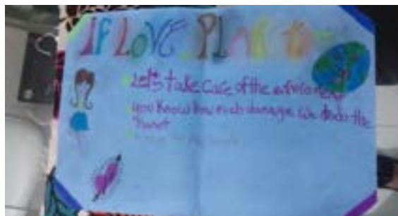
Foto 4. Muestra de posters hecho por los participantes.

poder comunicar sus ideas y percepciones sobre los problemas ambientales, en inglés, lo cual se puede apreciar en la foto 4.