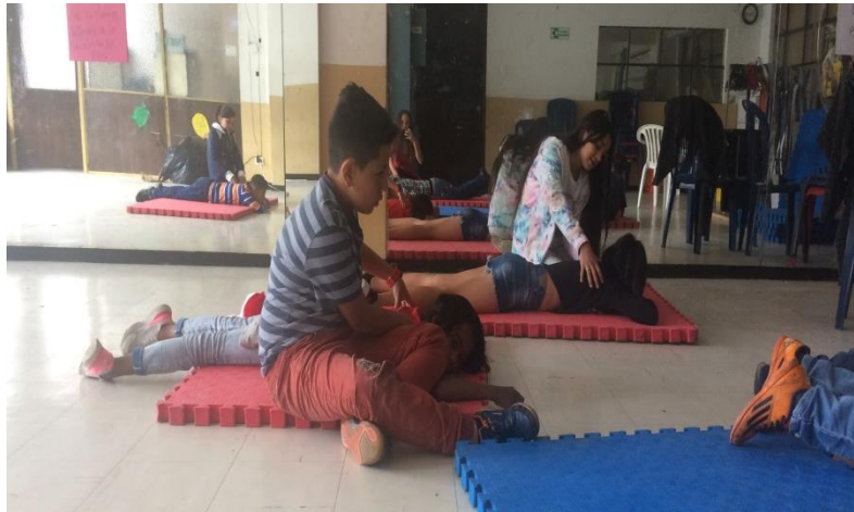
Ilustración 6. Sesión de masaje al otro con Navegantes.

Estos ejercicios permitieron que los niños se soltaran ante las tensiones que normalmente tienen y que se reflejan al momento de bailar, soltar el cuerpo, liberar todo el peso sobre el peso del otro son acciones físicas que tienen relación directa con el estado psicológico o anímico que atraviesa el danzante, por eso se cree que permitirles confiar en el otro en el aula es abrirles el espectro a que puedan confiar también en la calle, en el colegio y en general en todos los ambientes donde se desarrolla su vida diaria.