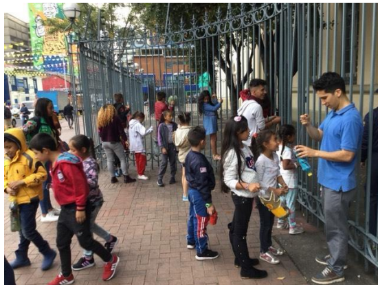
Ilustración 8. Exploradores en taller de creación de ceniceros. Casabierta 2019.

asistieran como público a las muestras de danza urbana, contemporánea, danza búto y banda de rock organizadas por alumnos y maestros de la facultad de Artes ASAB.