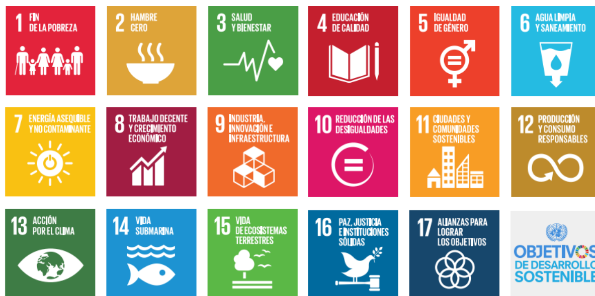
Figura 1. Objetivos del Desarrollo Sostenible (ODS) como objetivos para la agenda 2030. Fuente: Naciones Unidas, 2016.