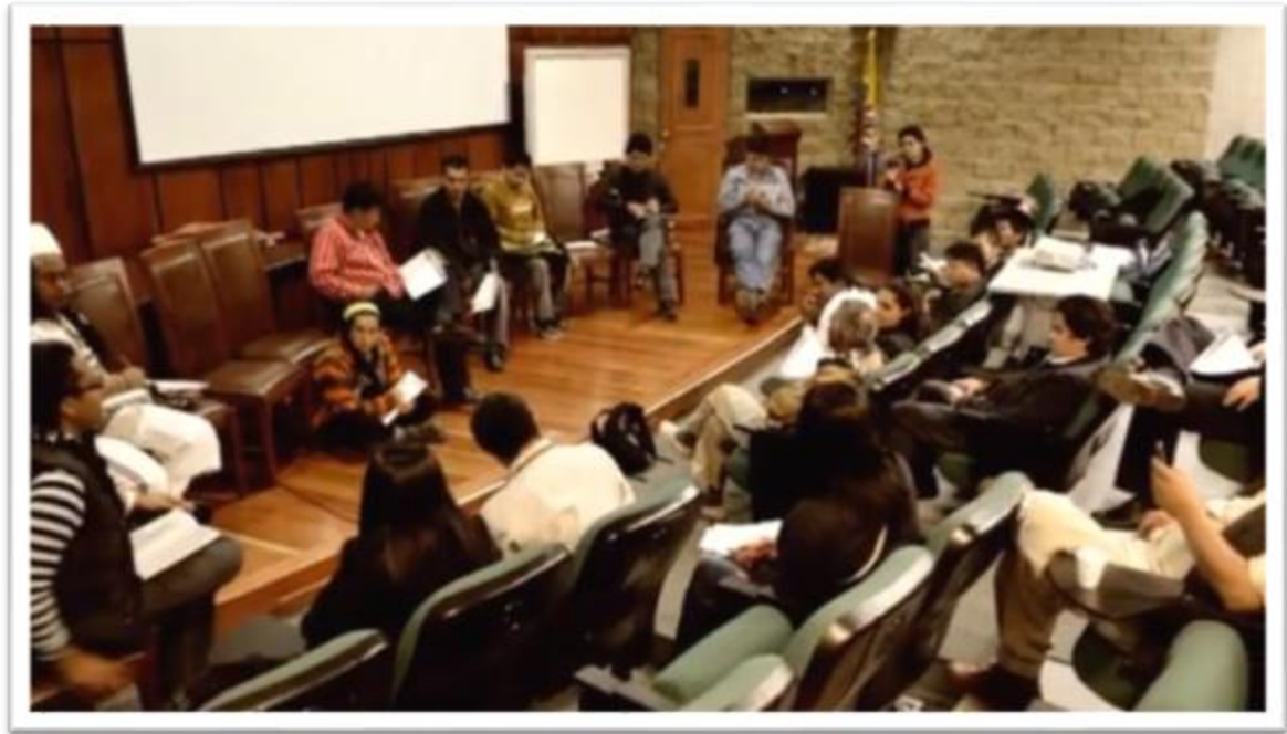
en el espacio de concertación con los grupos étnicos llevados a cabo en las instalaciones de la Universidad Distrital Francisco José de Caldas, en la sede de la 40. Durante el mes de marzo de 2013